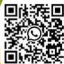
JUAN DANIEL OVIEDO ARANGO Concejal de Bogotá Con Toda Por Bogotá